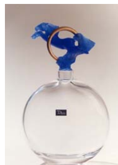
Carafe Daum – collection des musées de Cognac