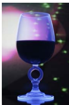
Verre Cahors fluorescents