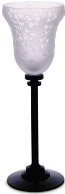
Nina – Stéphanie Balini pour Baccarat

Cette exposition propose d'explorer diverses variations autour du service à boire à travers l'univers de quelques créateurs contemporains.