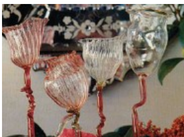
Création Diane Castéja