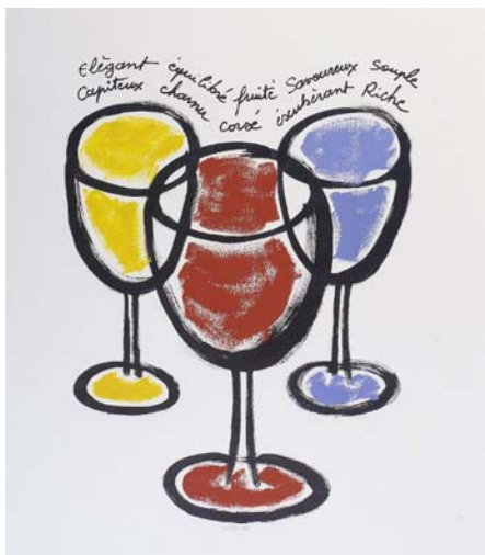
Technique mixte photo studio Langereau © ADAGP 2006

Dans l'exposition, la confrontation de l'œuvre sculptée, plutôt monochrome et du foisonnement coloré des œuvres graphiques offre un heureux jeux-d'artifice visuel.