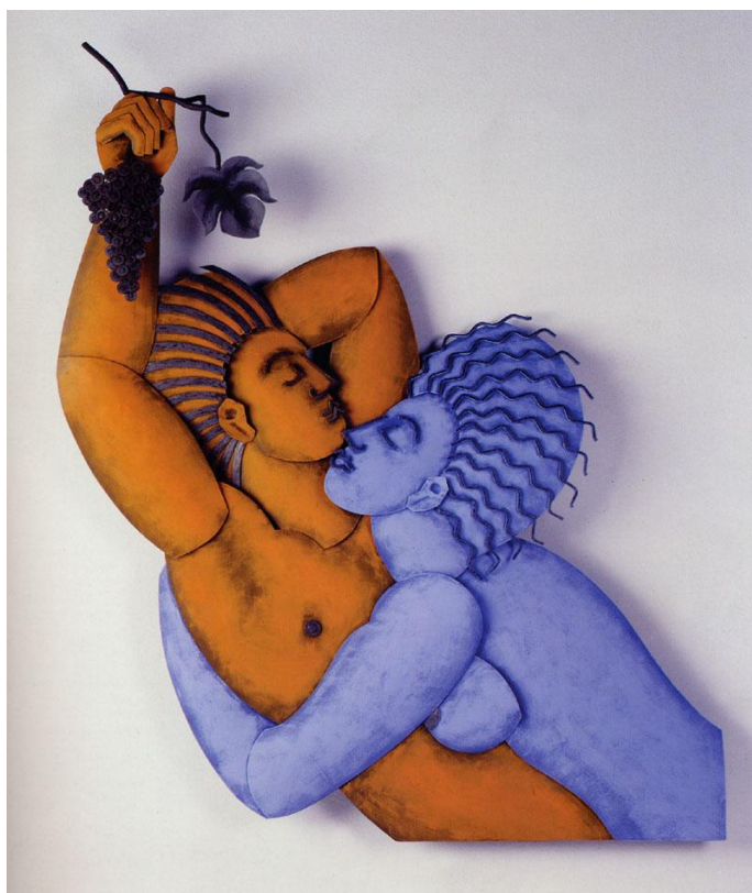
La Grappe, bas-relief acier et pigments à l'huile

Bernard Matignon, 1997 (extrait de Baisers d'acier, Saintes, Musée de l'Echevinage, catalogue d'exposition)