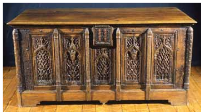
Coffre sculpté avec serrure 15 e /16 e siècle inv.955.9