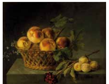
Joseph Laurent Malaine, Corbeille de pêches, inv.892.1.21