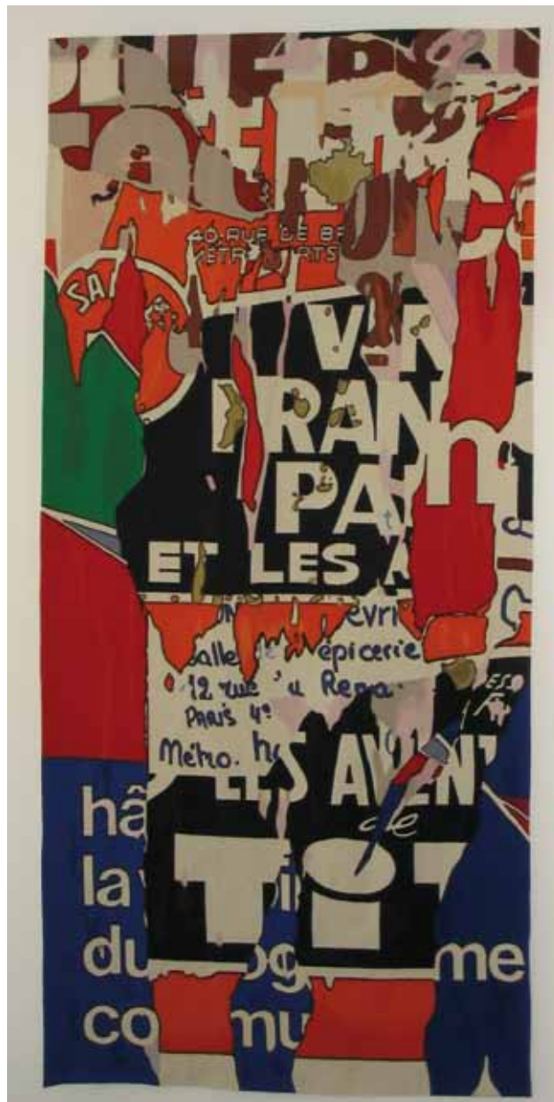
Jacques Villeglé, Les carrés magiques, inv.n°D.2005.1.2

Existence officielle du mouvement en 1924