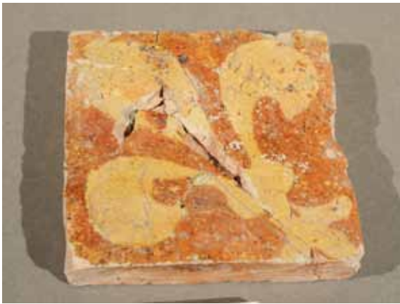
Carreau de pavage

La terre cuite est également utilisée pour réaliser d'autres éléments comme les cornes d'appel ou les carreaux de pavage destinés au sol des demeures des grands personnages de l'époque.