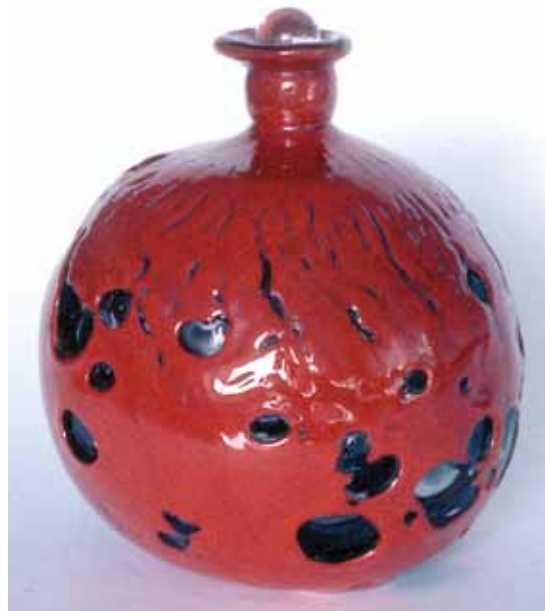
Yvette Alde, Le jugement de Pâris, 1957, inv.964.20.1