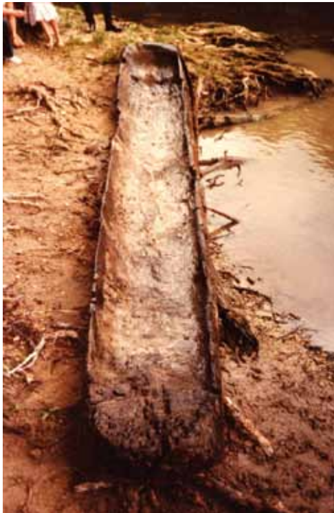
Pirogue néolithique de Bourg-Charente, inv.D.985.2.1

Au Néolithique l'homme passe de la prédation à la production. Invention de la céramique et du modelage de la terre – le premier art du feu).