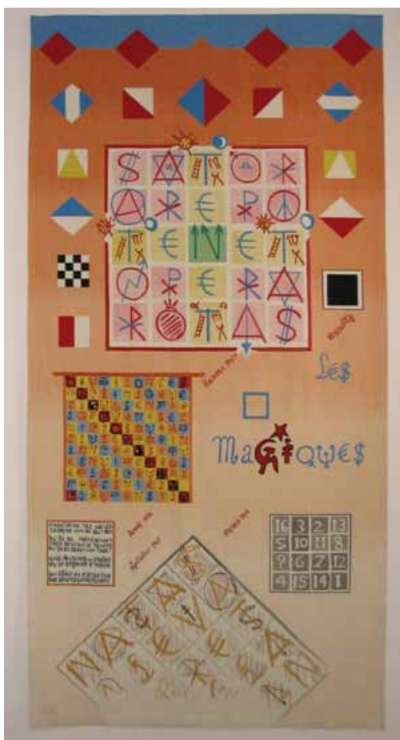
Jacques Villeglé, Rue de Bretagne, inv.D.2005.1.1