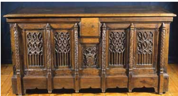
Coffre sculpté 15 e /16 e siècle inv.955.3